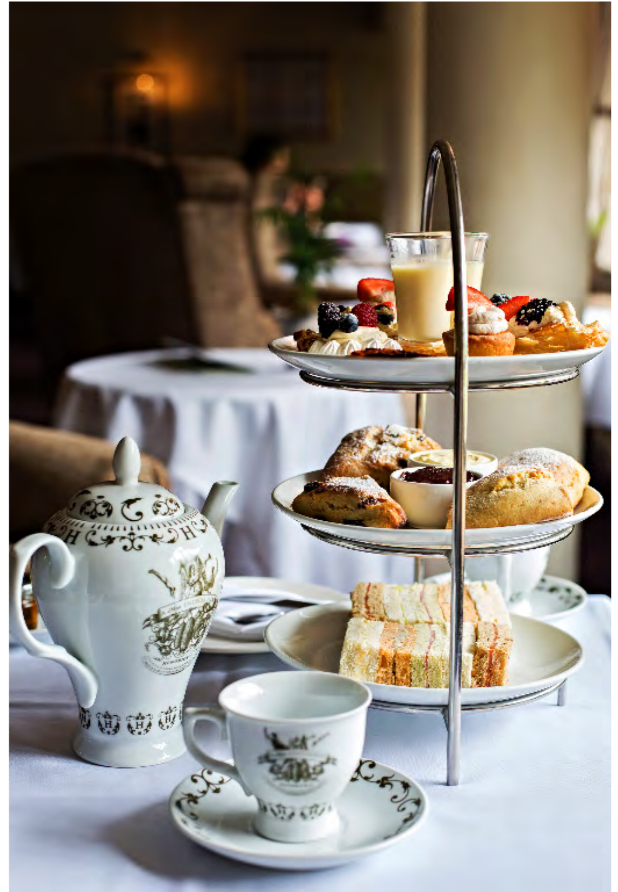
Afternoon Tea and British elevenses (scones & tea)