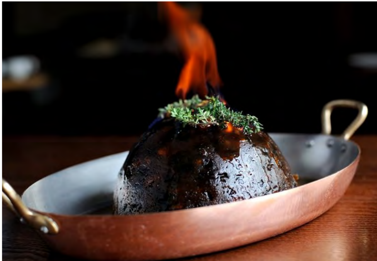
Christmas Pudding with Brandy